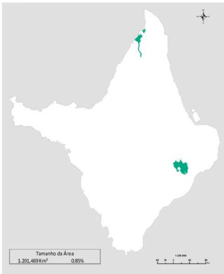
Figura 16 - Zona 1.4.4 Terras com Antropização Dominante