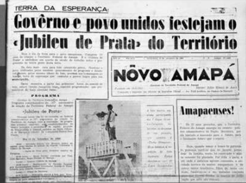
1968: CRIAÇÃO DO JORNAL NOVO AMAPÁ EM SUBSTITUIÇÃO AO AMAPÁ