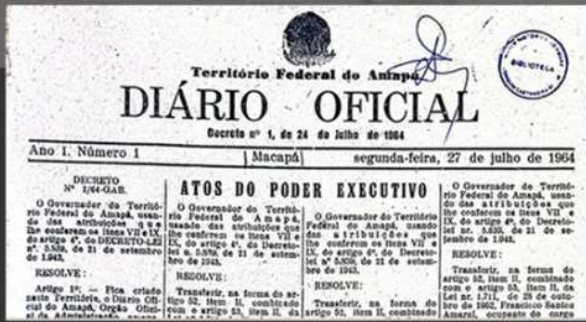
1964: CRIAÇÃO DO DIÁRIO OFICIAL DO ESTADO