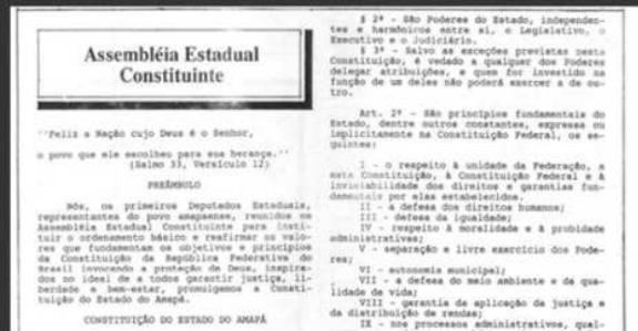
1991: PUBLICAÇÃO DA CONSTITUIÇÃO DO ESTADO DO AMAPÁ NO DIÁRIO OFICIAL