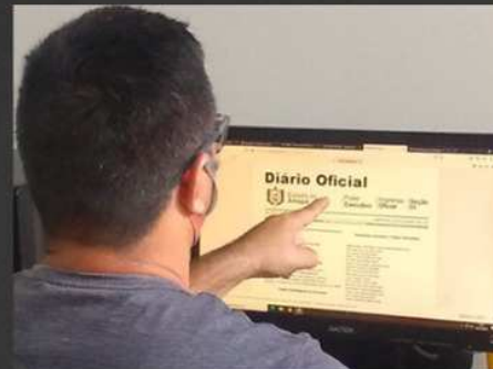
2016: ENCERRAMENTO DA PUBLICAÇÃO IMPRESSA DO DIÁRIO OFICIAL E INÍCIO DA CIRCULAÇÃO EM FORMATO PDF, QUE ERA FRUTO DA DIGITALIZAÇÃO DA BONECA.