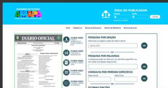
2019: IMPLANTAÇÃO DE UM SISTEMA INFORMATIZADO PARA A PRODUÇÃO E PUBLICAÇÃO DO DIÁRIO OFICIAL, DEIXANDO DE LADO MONTAGEM MANUAL DA BONECA.