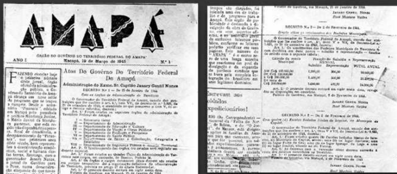
1945: PUBLICAÇÃO DA EDIÇÃO NÚMERO 1 DO JORNAL AMAPÁ, PRIMEIRO PRODUTO DA IMPRENSA OFICIAL DO AMAPÁ E APENAS O SEGUNDO JORNAL A CIRCULAR NO AMAPÁ.