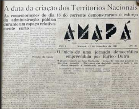
1943: CRIAÇÃO DO TERRITÓRIO FEDERAL DO AMAPÁ